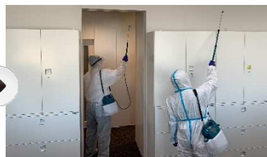
除菌剤の噴霧作業